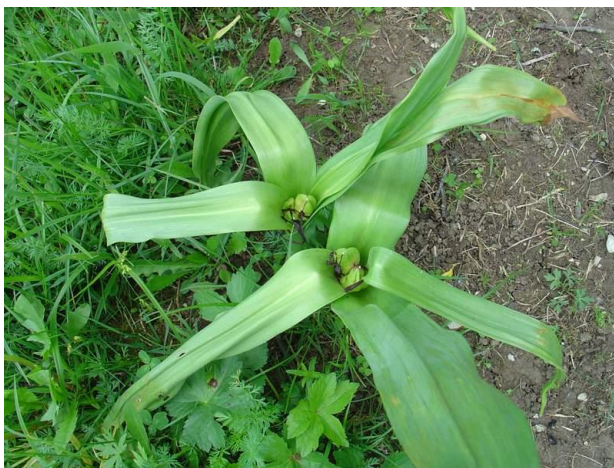
Herbstzeitlose mit Samenkapseln Ende Mai 2015

Die Herbstzeitlose ist eine äußerst giftige Pflanze, die vor allem in Extensivgrünland vorkommt. Futter, das zu viel Herbstzeitlose enthält, kann nicht an Tiere verfüttert werden. Intensive Grünlandnutzung, also ein früher erster Schnitt im Mai und eine hohe Düngegabe, schwächt die Herbstzeitlose. Für die Erhaltung von artenreichen Wiesen ist die Weiterführung einer extensiven Nutzungsweise aber Voraussetzung. Seit der Teilnahme an der Naturschutzmaßnahme WF (wertvolle Flächen) und der damit einhergehenden Extensivierung der Flächen und einer späteren Mahd ab Anfang Juli, kam es bei einem Betrieb zu einer Zunahme der Herbstzeitlosen. Da dieser nach wie vor von der Teilnahme an der Naturschutzmaßnahme WF überzeugt ist und gerne einen Beitrag zur Weiterentwicklung dieser Maßnahme bei gleichzeitiger Dezimierung der Herbstzeitlosen liefern möchte, wurde die Idee zu diesem Monitoringprojekt geboren. Von den daraus hervorgehenden Ergebnissen soll anschließend abgeleitet werden können, in wie weit man innerhalb der vorhandenen Möglichkeiten der ÖPUL-Maßnahme WF das Vorkommen der Herbstzeitlose verringern kann. Um hierbei einen Erfolg erzielen zu können, wurden zusätzlich die bisherige Nutzung auf zweimal Mahd/Jahr verändert sowie die Vorverlegung des Mähtermins von Anfang Juli auf Anfang Juni in der Projektbestätigung verankert.