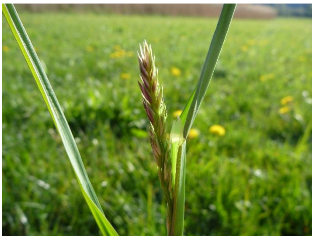
Rispschieben des Knäuelgrases

Bei der ÖPUL-Maßnahme Naturschutz haben die landwirtschaftlichen Betriebe meist ein fixes Datum für die Wiesenmahd vereinbart. Nicht zuletzt durch den Klimawandel schwankt die Vegetationsentwicklung vor allem im Frühjahr und Frühsommer von Jahr zu Jahr immer stärker. Deshalb wurde die Möglichkeit zur Flexibilisierung dieser Schnittzeitaufgaben entwickelt. Zu diesem Zweck beobachten weit über hundert LandwirtInnen in ganz Österreich den Verlauf der Vegetationsentwicklung anhand des Rispschiebens des Knäuelgrases und der Blüte des Schwarzen Holunders. Aus den gemeldeten Daten wird mit einem Modell für jede Region berechnet, ob es sich um ein frühes, normales oder spätes Jahr handelt. In einem warmen Jahr mit früher Vegetationsentwicklung können die Betriebe ihre WF-Wiesen bereits vor dem in der Projektbestätigung angegebenen Datum mähen. Dies gilt dann, wenn in Ihrer ÖPUL-Projektbestätigung die nicht prämienrelevante Auflage NI40 – "Vorverlegung des Schnittzeitpunktes gemäß www.mahdzeitpunkt.at möglich" angegeben ist. Die Information, ob und wieviel Tage früher die erste Mahd erfolgen kann, wird jedes Jahr zeitgerecht auf www.mahdzeitpunkt.at zur Verfügung gestellt.