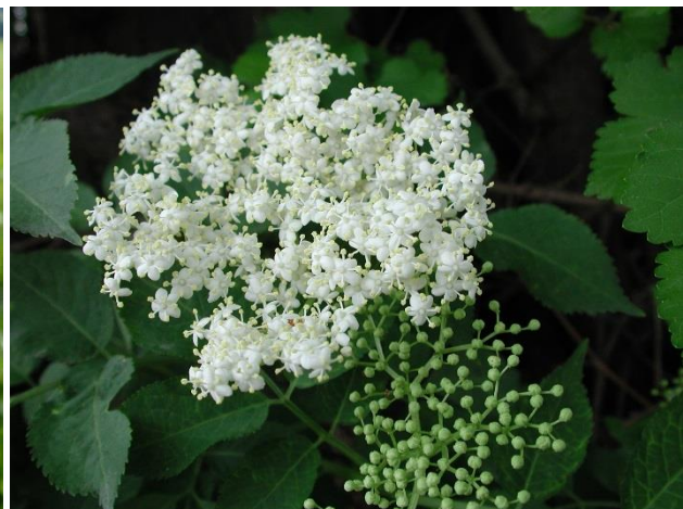
Blüte des Schwarzen Holunders