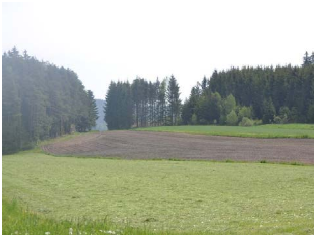
Ausschnitt eines Heidelerchenreviers

Im Jahr 2021 sind keine Beobachtungen der Zielarten zur Auswertung eingegangen.