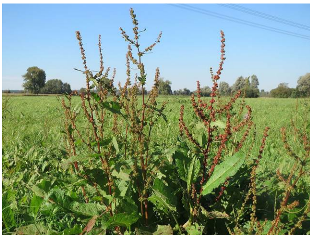
Stumpfbliättriger Ampfer

Beim Problempflanzen-Monitoring geht es darum, die Ausbreitung von Problempflanzen auf Grünlandflächen mit geeigneten Maßnahmen einzudämmen. Manche heimischen Pflanzen, wie die Herbstzeitlose und verschiedene Ampfer- und Distelarten, sind wegen ihrer Giftigkeit oder Ungenießbarkeit für Weidevieh problematisch und bereiten Schwierigkeiten bei der Grünlandbewirtschaftung. Ebenfalls zu den Problempflanzen gehören einige invasive Neophyten, also Pflanzen, die durch menschlichen Einfluss heimische Ökosysteme besiedelt haben, sich massiv ausbreiten und gebietstypische Ökosysteme stark verändern. Das ist zum Beispiel beim Japanischen Staudenknöterich, dem Drüsen-Springkraut oder der Kanadischen Goldrute der Fall. Im Rahmen des Monitoringprojektes werden die Pflanzen selektiv je nach Art zur richtigen Zeit gemäht, händisch oder mechanisch entfernt und abtransportiert. Die Maßnahmen müssen, je nach Problempflanze, über unterschiedlich lange Zeiträume, oft über mehrere Jahre, angewendet werden, bis sich der gewünschte Erfolg einstellt. So hat etwa die Herbstzeitlose eine mehrjährige Lebensdauer. Auch der Samenpool im Boden verändert sich erst im Laufe mehrerer Jahre. Die TeilnehmerInnen des Monitorings dokumentieren die gesetzten Maßnahmen auf ihren Wiesen und Weiden und liefern damit wertvolle Erfahrungswerte bei der langfristigen Problempflanzenbekämpfung auf landwirtschaftlichen Flächen.