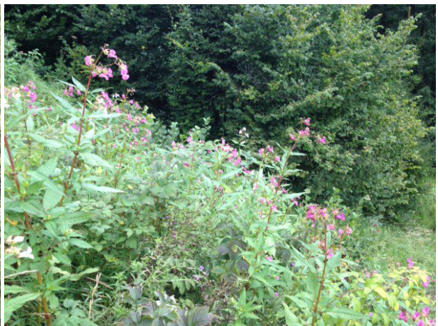
Fläche vor der händischen Entfernung des Drüsen-Springkraut

Auch im Jahr 2019 wurden die meisten Meldungen online aufgezeichnet. Es gibt eine Telefonhotline, um bei etwaigen Fragen behilflich zu sein bzw. die Onlineeingabe zu übernehmen, falls die BewirtschafterInnen keine Möglichkeit dazu hatten. Dies dient als Alternative zum Einsenden eines ausgefüllten Papierformulars an die jeweilige Naturschutzabteilung der Länder, wodurch Kosten für die Archivierung und Verwaltung gespart werden und langfristig eine bessere Auswertbarkeit der Daten ermöglicht wird. Bei der Onlineeingabe können auch Fotos, die vor der Pflege gemacht wurden, mit wenig Aufwand hochgeladen werden. Die teilnehmenden Betriebe werden zudem um eine Einschätzung gebeten, wie sich die Problempflanzendichte auf der Fläche seit dem Vorjahr entwickelt hat.