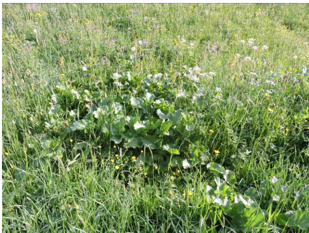
Fläche vor der händischen Ampfererentfernung