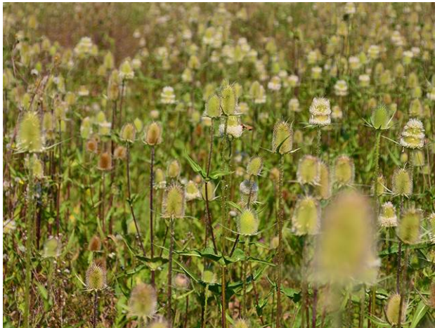
Schlitzeblättrige Karde