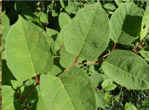
Japanischer Staudenknöterich