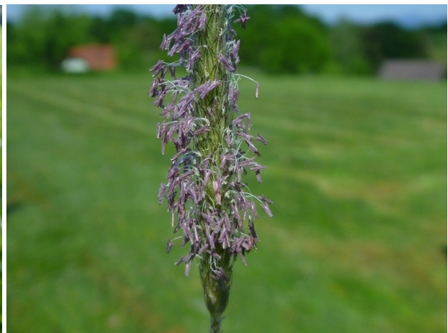
Blühbeginn des Wiesenfuchsschwanzes