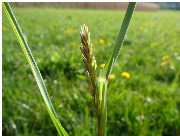
Rispschieben des Knäuelgrases

Bei der ÖPUL-Maßnahme Naturschutz haben die landwirtschaftlichen Betriebe meist ein fixes Datum für die Wiesenmahd vereinbart. Nicht zuletzt durch den Klimawandel schwankt die Vegetationsentwicklung vor allem im Frühjahr und Frühsommer von Jahr zu Jahr immer stärker. Deshalb wurde die Möglichkeit zur Flexibilisierung dieser Schnittzeitaufgaben entwickelt. Zu diesem Zweck beobachten weit über hundert LandwirtInnen in ganz Österreich den Verlauf der Vegetationsentwicklung anhand des Rispschiebens des Knäuelgrases und der Blüte des Schwarzen Holunders. Aus den gemeldeten Daten wird mit einem Modell für jede Region berechnet, ob es sich um ein frühes, normales oder spätes Jahr handelt. In einem warmen Jahr mit früher Vegetationsentwicklung können die Betriebe ihre WF-Wiesen bereits vor dem in der Projektbestätigung angegebenen Datum mähen. Dies gilt dann, wenn in Ihrer ÖPUL-Projektbestätigung die nicht prämienrelevante Auflage NI40 – "Vorverlegung des Schnittzeitpunktes gemäß www.mahdzeitpunkt.at möglich" angegeben ist. Die Information, ob und wieviel Tage früher die erste Mahd erfolgen kann, wird jedes Jahr zeitgerecht auf www.mahdzeitpunkt.at zur Verfügung gestellt.