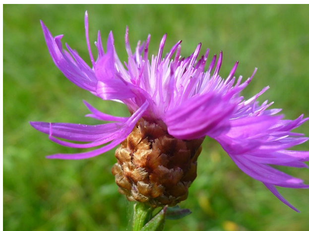
Blüte der Wiesenflockenblume