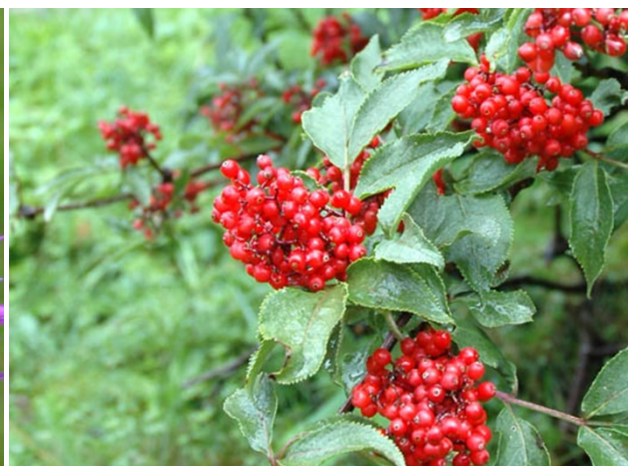
Fruchtreife des Roten Holunder