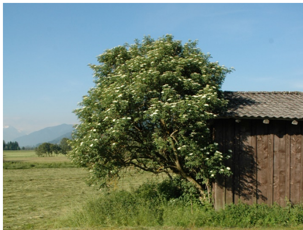
Vollblüte des Schwarzen Holunders

Die prämierelevante WF-Auflage „Schnittzeitpunktverzögerung anhand phänologischer Zeigerpflanzen“ ist ein europaweit einzigartiger Zugang, der auf wertvollen Mähwiesen gleichzeitig die Anliegen des Naturschutzes berücksichtigt und eine praktikable Bewirtschaftung gewährleistet. Dabei wird der Schnittzeitpunkt an Blüh- und Fruchtphasen ausgewählter Zeigerpflanzen ausgerichtet. Sobald etwa der Schwarze Holunder in Vollblüte steht, darf die Wiese gemäht werden. Durch diesen innovativen Ansatz werden die Schwankungen in der Vegetationsentwicklung - die durch den Klimawandel zunehmend verstärkt werden - automatisch berücksichtigt und eine auf die Naturentwicklung vor Ort bestens abgestimmte Flexibilität ermöglicht. Das Mähgut kann besser verwertet werden, womit auch die Akzeptanz der WF-Maßnahme im ÖPUL steigt. Gleichzeitig wird die alte Tradition der Naturbeobachtung wiederbelebt. Durch die Rückmeldung des Datums, an dem die jeweilige phänologische Phase der Zeigerpflanze eintritt, werden durch die Betriebe zudem wertvolle Daten gewonnen, welche die lokalen Klimaschwankungen bestens dokumentieren.