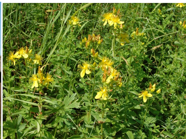
Blüte des Gefleckten Johanniskraut